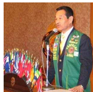
サパ°ロツLC会長挨拶