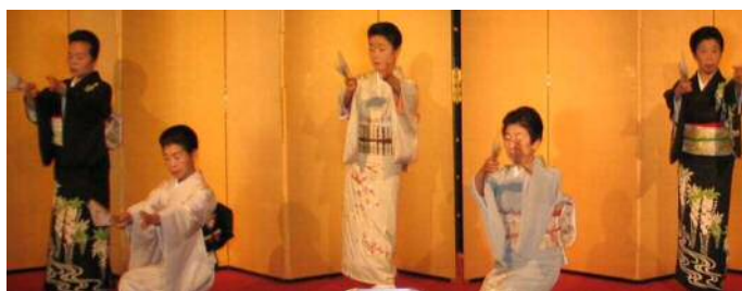
浜松芸者連 祝の舞