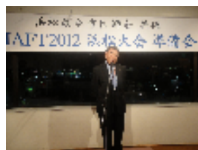
11/27 浜松医科大学市民講座