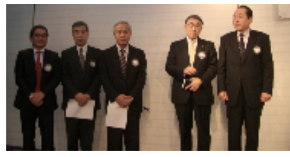
新会員の皆様とスポンサー挨拶