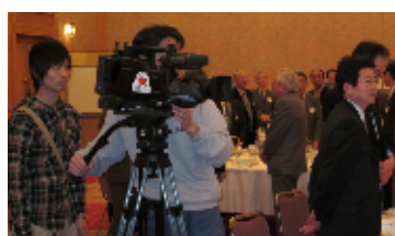
静岡朝日テレビの取材