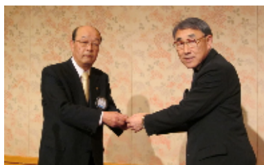
会員優秀ラペルピン贈呈