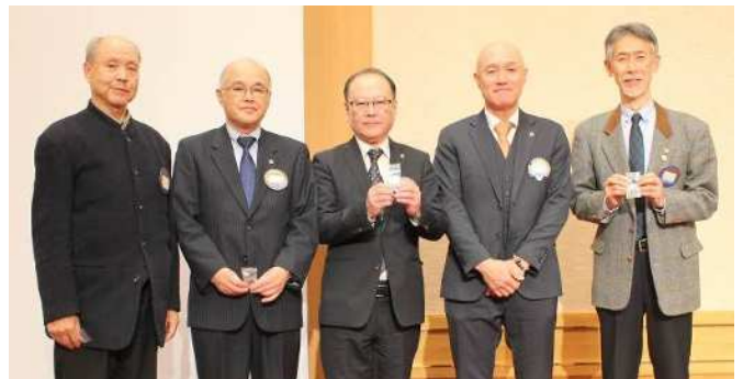
アテンダンス・アワード