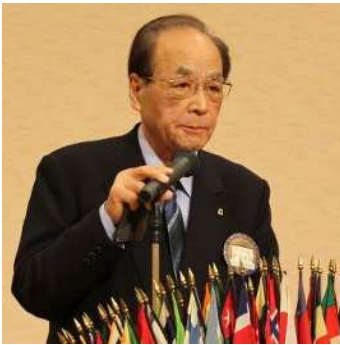
次期役員候補者指名会